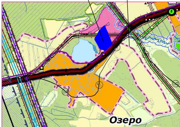
Схема использования территории в период подготовки проекта планировки, М1:2000